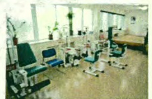
〈トレーニングマシン〉