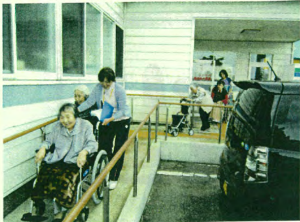
〈避薬佳言川糸東にて〉