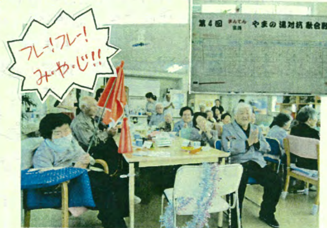
〈第4回 やまの湯対抗 歌合戦にて〉