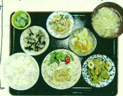
〈今月のある一日の昼食〉