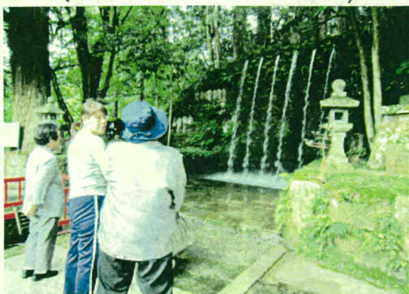
〈上市 大岩山へ参拝にて〉