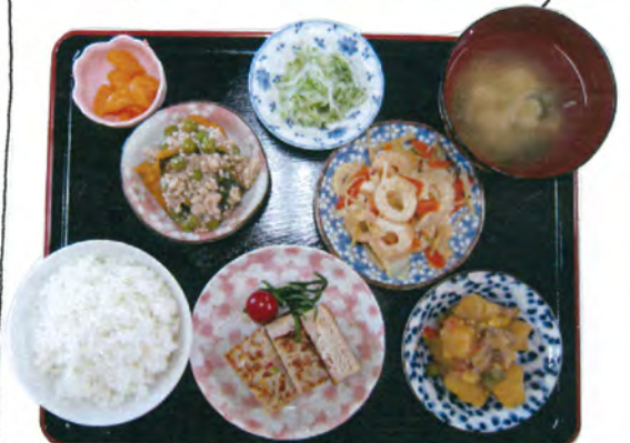
〈今月のある日の昼食〉