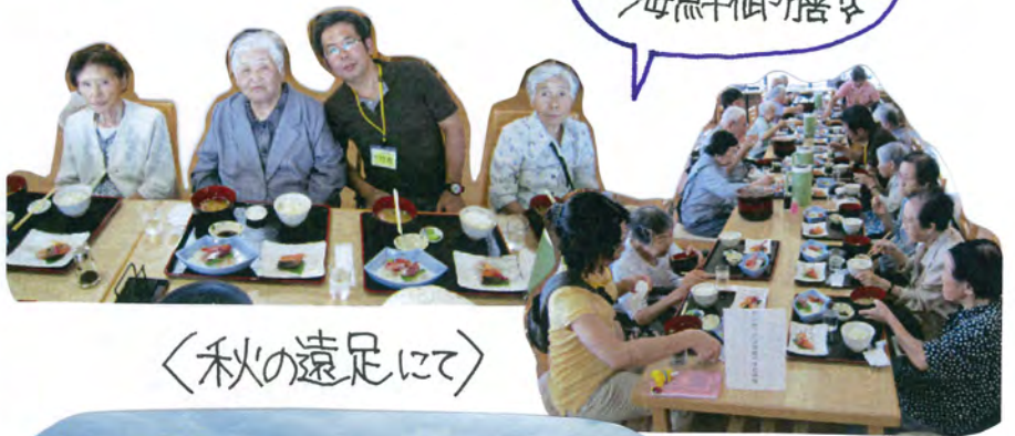
きとさと市場にて 海鮮御膳な